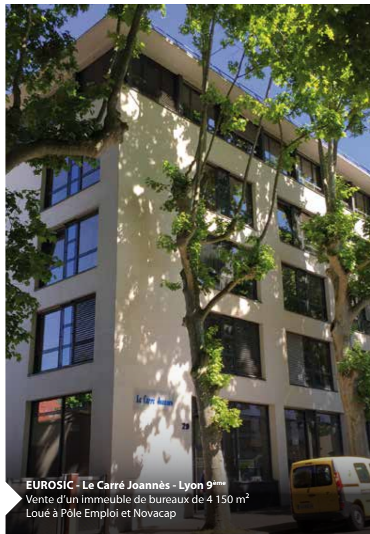
EUROSIC - Le Carré Joannès - Lyon 9 ème Vente d'un immeuble de bureaux de 4 150 m 2 Loué à Pôle Emploi et Novacap