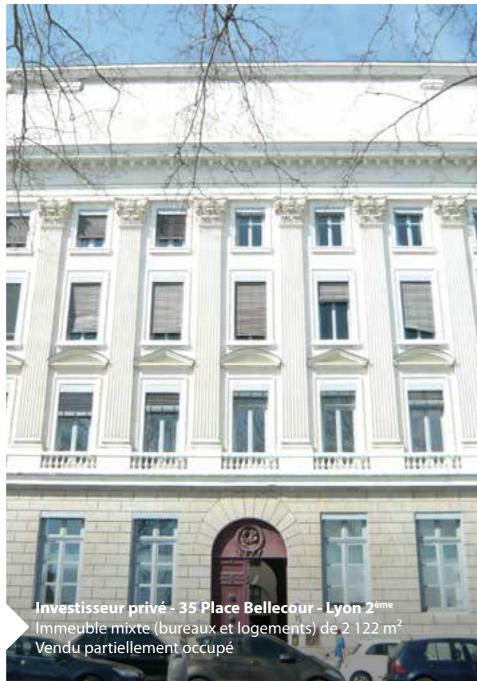
Investisseur privé - 35 Place Bellecour - Lyon 2 ème Immeuble mixte (bureaux et logements) de 2 122 m 2 Vendu partiellement occupé