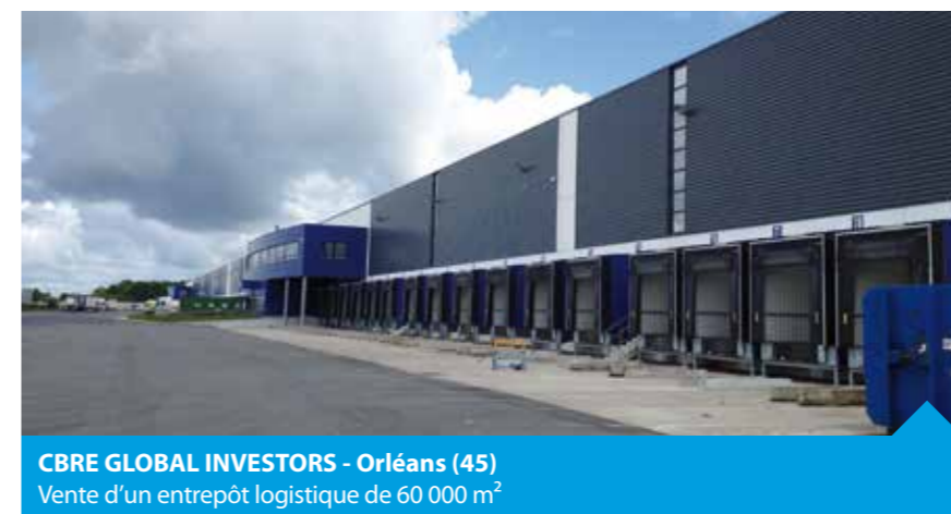
CBRE GLOBAL INVESTORS - Orléans (45) Vente d'un entrepôt logistique de 60 000 m 2