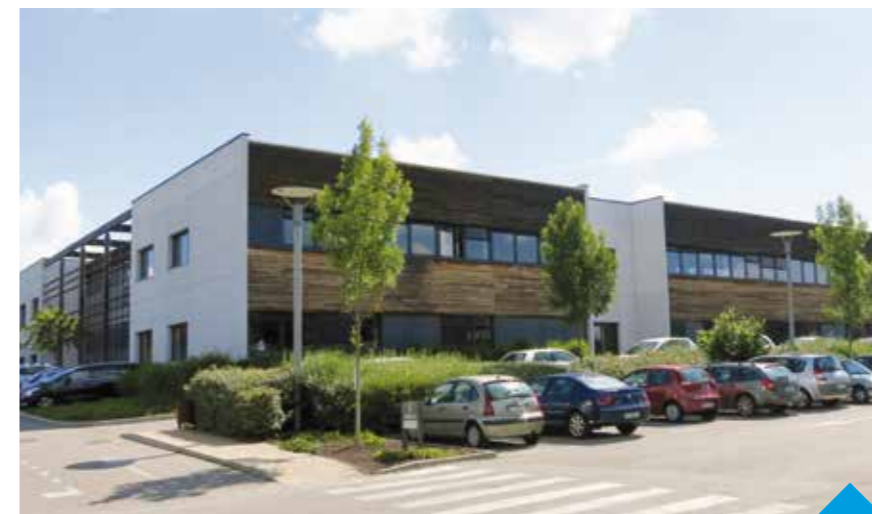
SOFIDY - Parc Technologique « Woodstock » - Saint-Priest (69) Vente d'un immeuble de bureaux de 5 000 m 2 , loué à Intrum Justitia