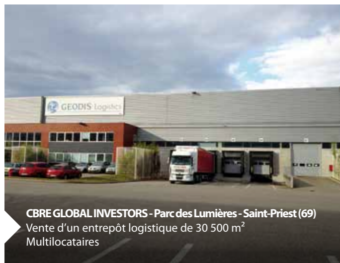
CBRE GLOBAL INVESTORS - Parc des Lumières - Saint-Priest (69) Vente d'un entrepôt logistique de 30 500 m 2 Multilocataires