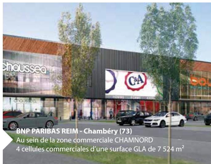
BNP PARIBAS REIM - Chambéry (73) Au sein de la zone commerciale CHAMNORD 4 cellules commerciales d'une surface GLA de 7 524 m 2

VALORISATION ET EXPERTISE : Membre de la Chambre des Experts Immobiliers de France (FNAIM), RICS.